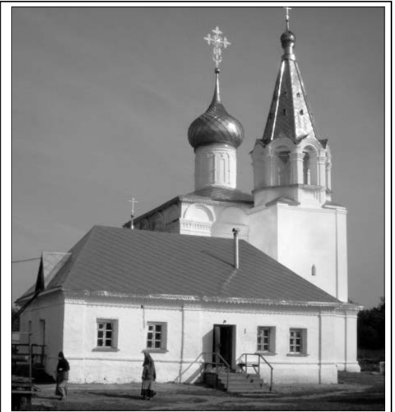
25 июля Гороховецкий Знаменский женский монастырь отмечает 10 лет со дня возрождения (1999 г.)

Знаменский Красногрицкий монастырь – самая ранняя обитель на гороховецкой земле. Мужской монастырь возник здесь еще во времена Бориса Годунова в 1598 г. А в 1723 г. Указом Петра I монастырь был упразднен и передан Флорищевой пустыни. До начала XX века являлся подворьем пустыни.