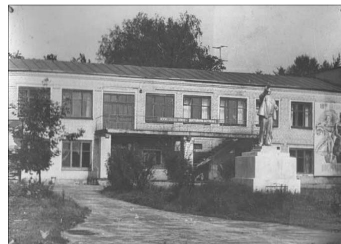
Здание сельского совета в районном центре – с.Фоминки. 50-е годы XX века.

50 лет назад (1959г.) Указом Президиума Верховного Совета РСФСР ликвидирован Фоминский район (образован в 1929 г.) с передачей его территории в состав Гороховецкого, Вязниковского и Муромского районов.