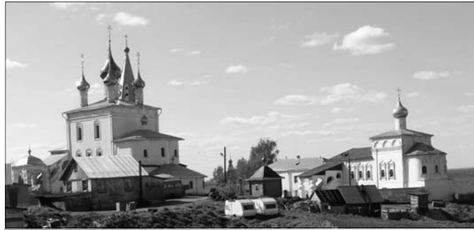
Гороховецкий Свято-Троице-Никольский монастырь. Начало XXI века.