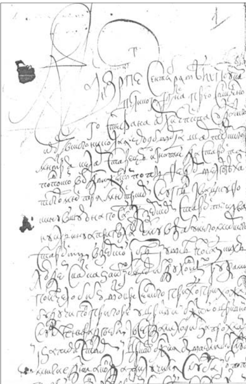
Акт XVII века Григорье-Воскресенской церкви г.Шуи из собрания В.А.Борисова