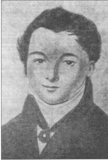
Иван Михайлович Симонов.

215 лет со дня рождения (1794г.) Ивана Михайловича Симонова . Родился в Гороховце в мещанской семье. Астроном, профессор (1816г.) и ректор (1847г.) Казанского университета, член Парижского географического общества (1824г.), Римской академии наук (1825г.), Русского географического общества (1846г.), французского общества статистики (1847г.). Участник и автор первого подробного описания кругосветной экспедиции Беллинсгаузена и Лазарева, открывшей Антарктиду и множество островов. Автор ряда астрономических изобретений. Основатель одной из лучших в России и Европе обсерватории в г. Казань.